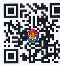
繼承案件地方稅 預約查欠