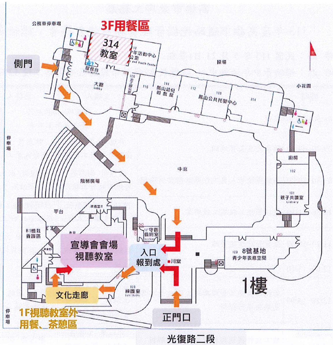
宣導會會場路線圖